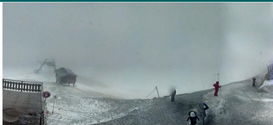
Mardi . Pluie . +2 °c