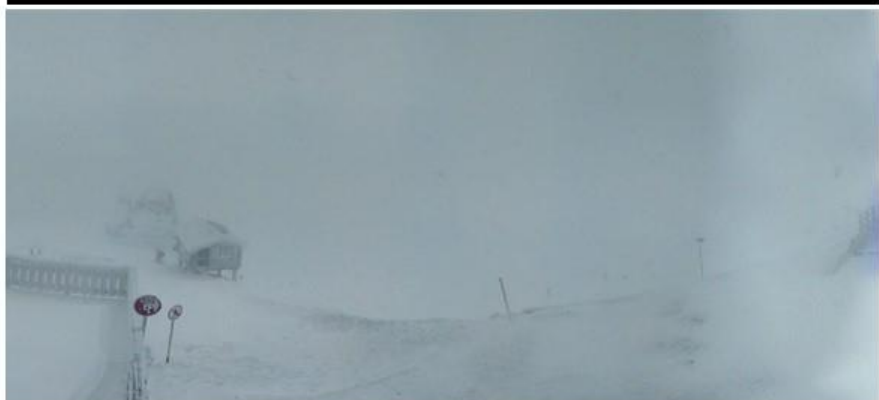
Mercredi . Neige . -6 °c