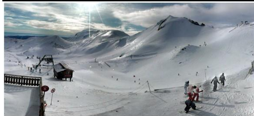
Jeudi . Variable . -2 °c

Le Mont-Dore • La Bourboule • Besse/Super Besse • Muriol • Chambon-sur-Lac • Saint-Nectaire • Murat-le-Quaire • Chastreix Picherande • Saint-Victor-la-Rivière • Égliseneuve d'Entraigues • Saint-Diéry • Saint-Pierre-Colamine • Compains • Espinchal • Valbelex • Le Vernet-Sainte-Marguerite • Montgreleix • Saint-Genès-Champespe • La Godivelle