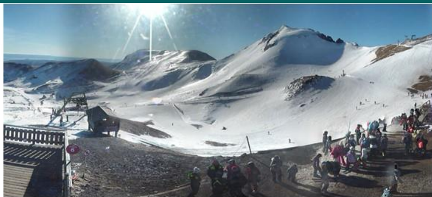
Lundi . Soleil . +12 °c